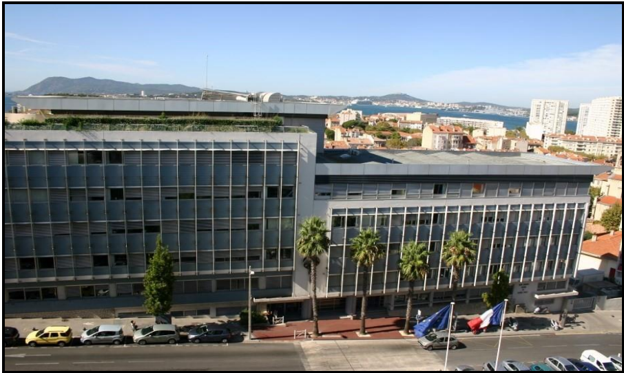
Bâtiment bleu de la CNMSS

Les surfaces approximatives du bâtiment, fournies à titre indicatif, sont les suivantes :