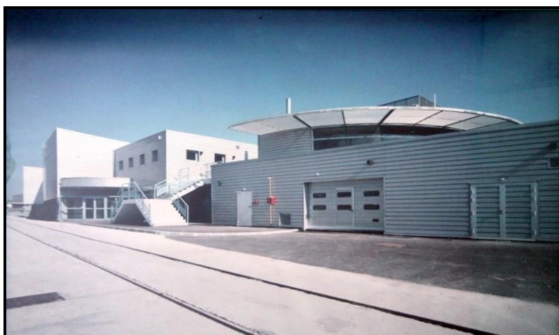
Bâtiment de stockage d'archives et de bureaux de la CNMSS situé à La Garde

Le bâtiment possède une zone sur 2 niveaux. L'étage est accessible que depuis des escaliers intérieurs et/ou extérieurs.