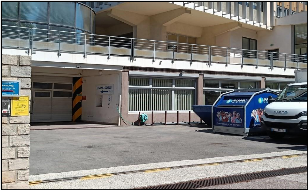
Photographie de l'entrée du magasin approvisionnement du bâtiment brun à utiliser obligatoirement pour les chargements / déchargements de matériels et fournitures

Le stationnement sera temporaire et limité au temps de chargement/déchargement du camion, cette entrée étant utilisée pour de nombreuses livraisons.