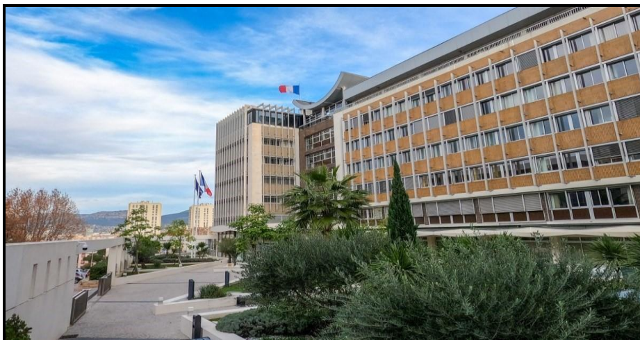
Bâtiment brun de la CNMSS

Les surfaces approximatives du bâtiment, fournies à titre indicatif, sont les suivantes :