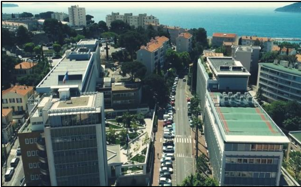
Bâtiments brun et bleu de la CNMSS